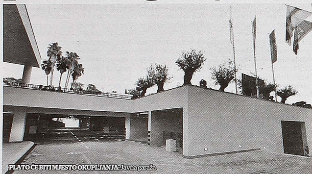
PLATO ČE BITI MJESTO OKUPljanja: Javna garaža

Objekat čija je izgradnja koštala 3,9 miliona eura olakšaće pristup i boravak u centru grada, u velikoj mjeri biće rasterećen mirujući saobraćaj, a vrijeme traženja parkinga biće skraćeno