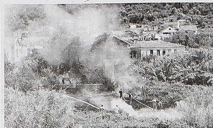
VATRA SE BRZO ŠIRILA: Lokacija na kojoj je gorjelo